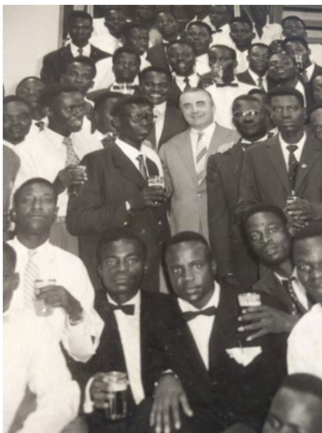
Verre de fin d'année, 1958, Caisse d'Épargne, Léopoldville

« Ma mère venait de l'Équateur, de Bandaka. Elle était venue très jeune avec son papa à Matadi. Il travaillait à la Compagnie Maritime Belge. Il naviguait. Mon grand-père était donc marin. Il voyageait entre Anvers et Matadi. A force de côtoyer les Blancs, il avait acquis leur mentalité. Sa mentalité avait « blanchi ». Il faisait rêver toute la famille. On voulait copier les blancs. »